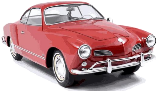
Volkswagen Karmann-Ghia Coupé