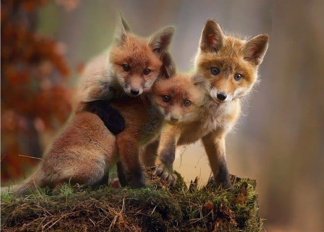
Abb. Der Rotfuchs hat seinen Namen aufgrund seiner Fellfarbe